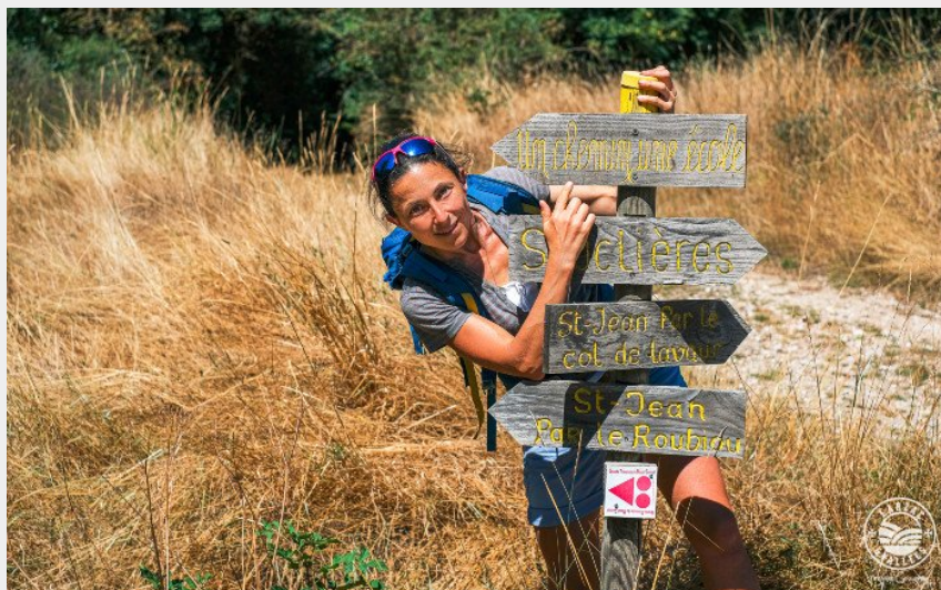
Sur le circuit...