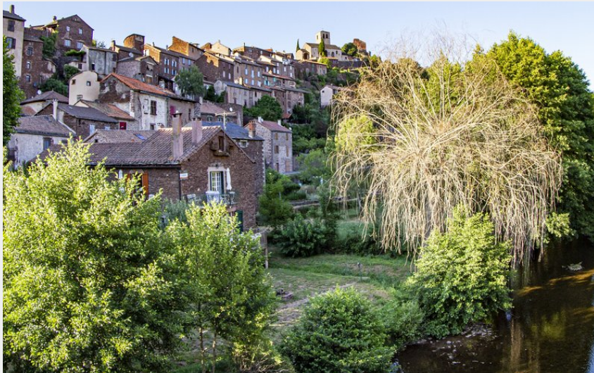
Boucle de Combret