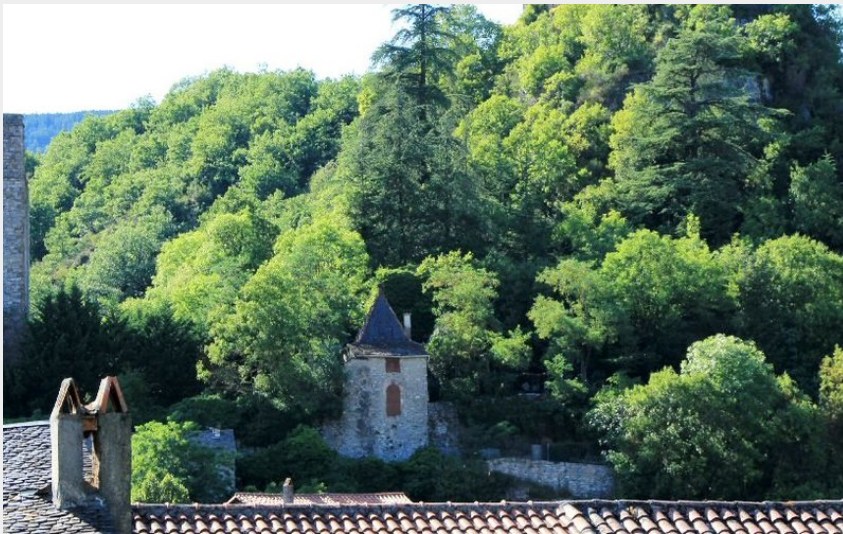
Brusque (OT Rougier Aveyron Sud)