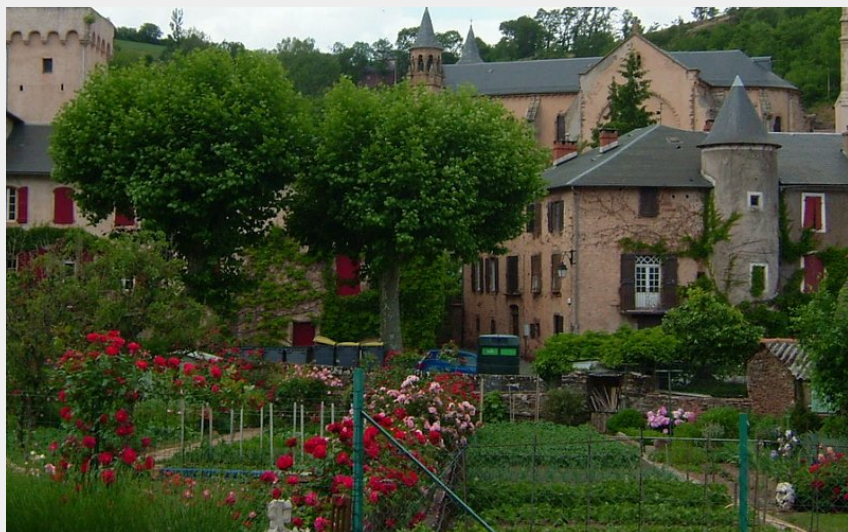
Village de St Sever (OT Belmont)