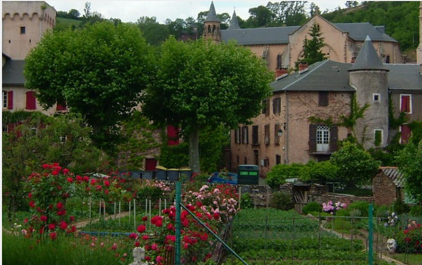
Village de St Sever (OT Belmont)