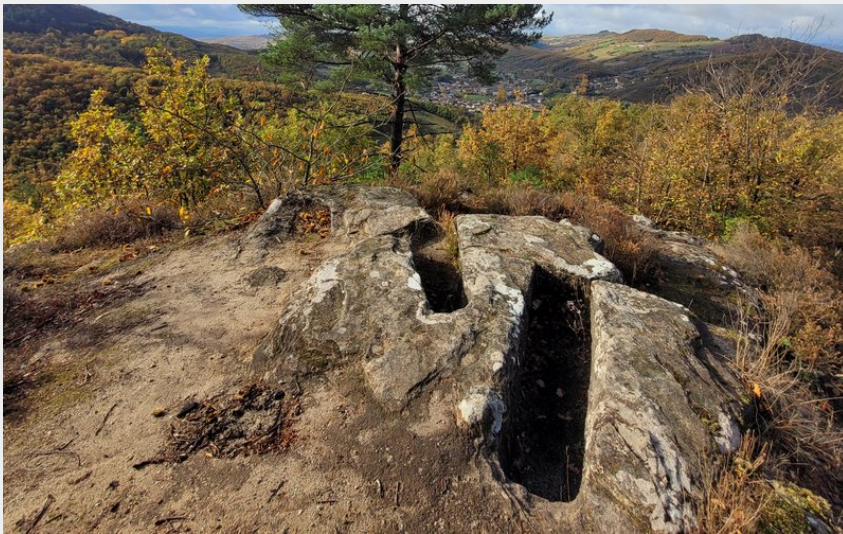
Les tombes