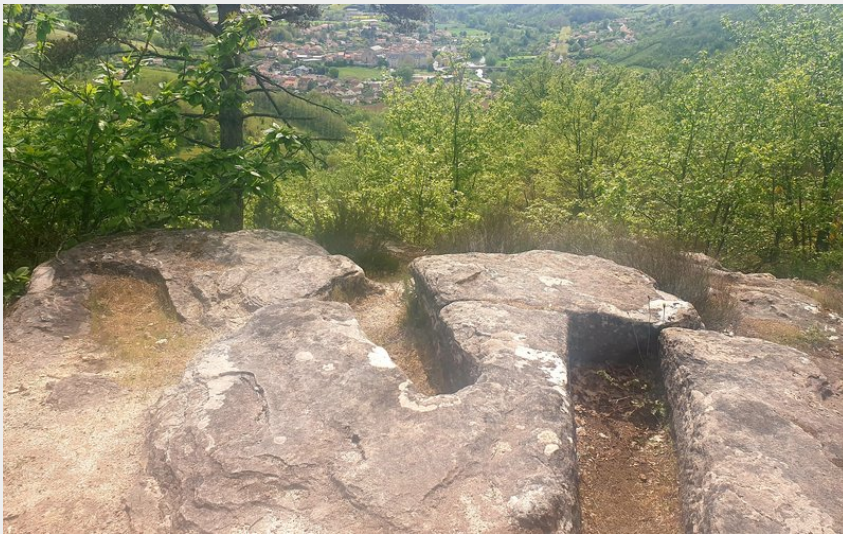
Tombes rupestres du Vieuzet (Roquefort Tourisme)