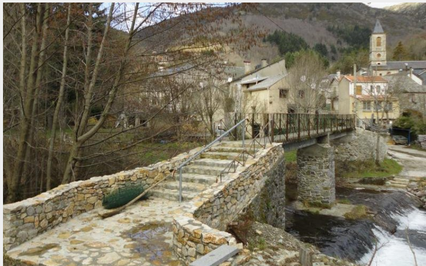
Passerelle du départ (Mairie)