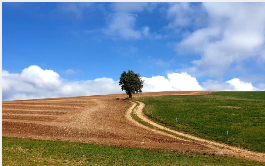
De St Félix à la Loubière (Roquefort Tourisme)