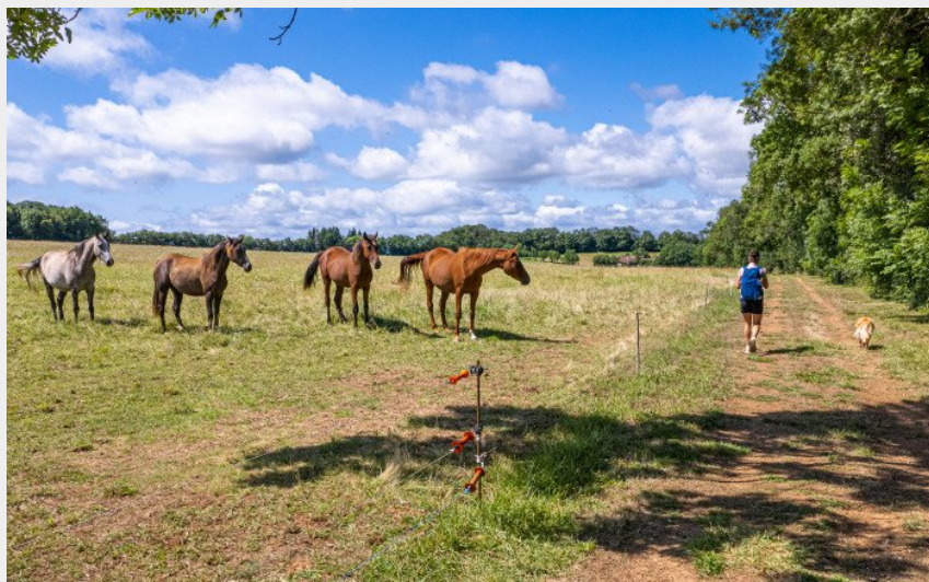
Autour de La Fageole