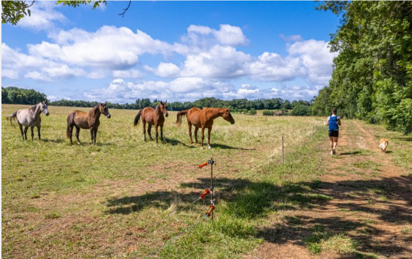
Autour de La Fageole