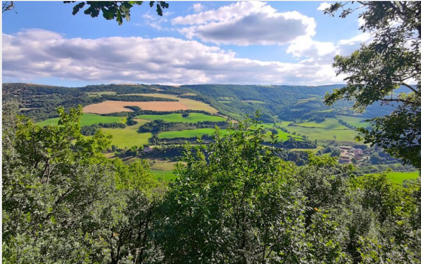
Notre Dame du Cayla (Roquefort Tourisme)