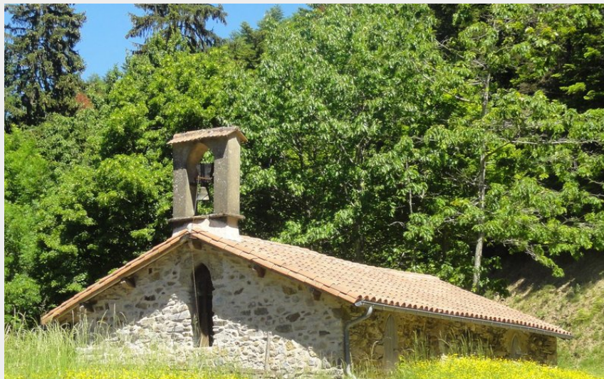
Ermitage St Thomas (C.Bouzat)