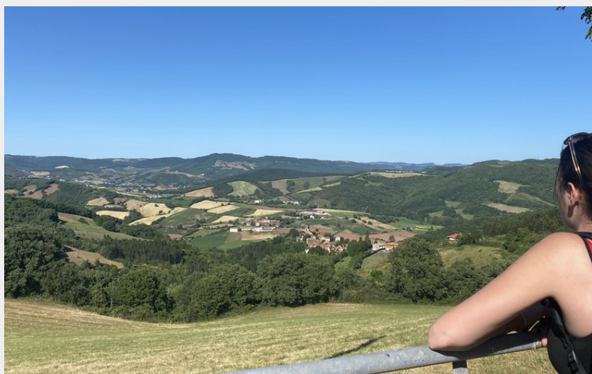
Sur les chemins de femmes de la terre (Roquefort Tourisme)