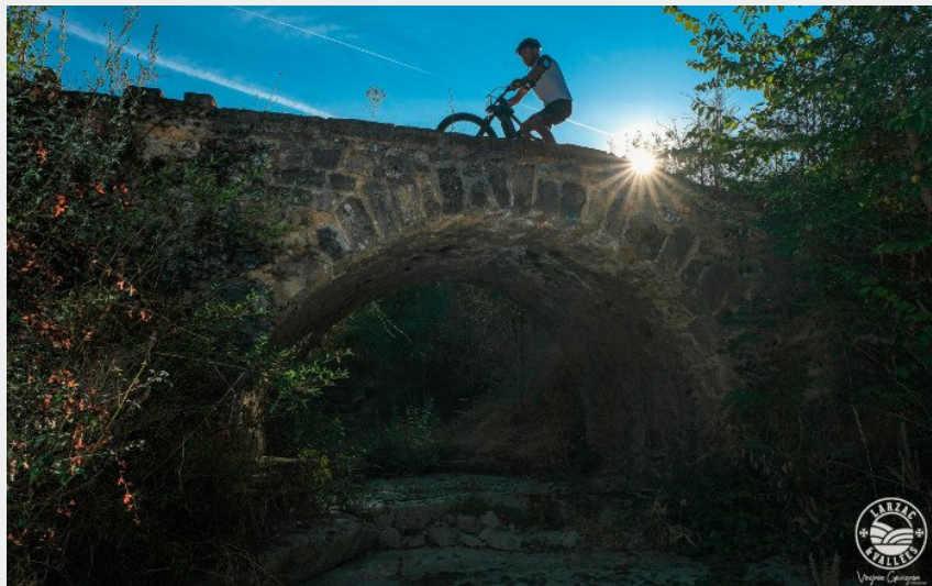
Sur le pont romain