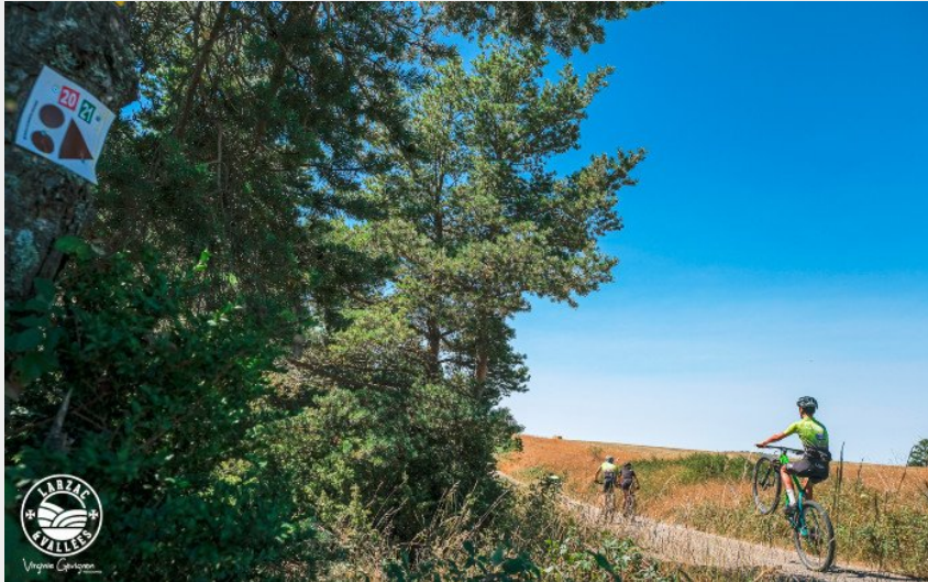
Sur le causse bégon... (Virginie Govignon - OT Larzac et Vallées)