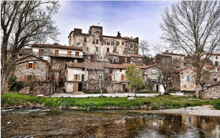
Le château de Latour