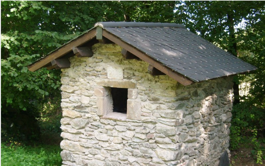
Puit (OT Rougier Aveyron Sud)