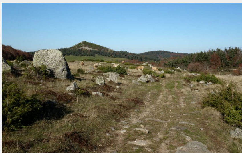
Le Pic de Mus et les pâtures de St-Laurent-de-Muret (PNR Aubrac)