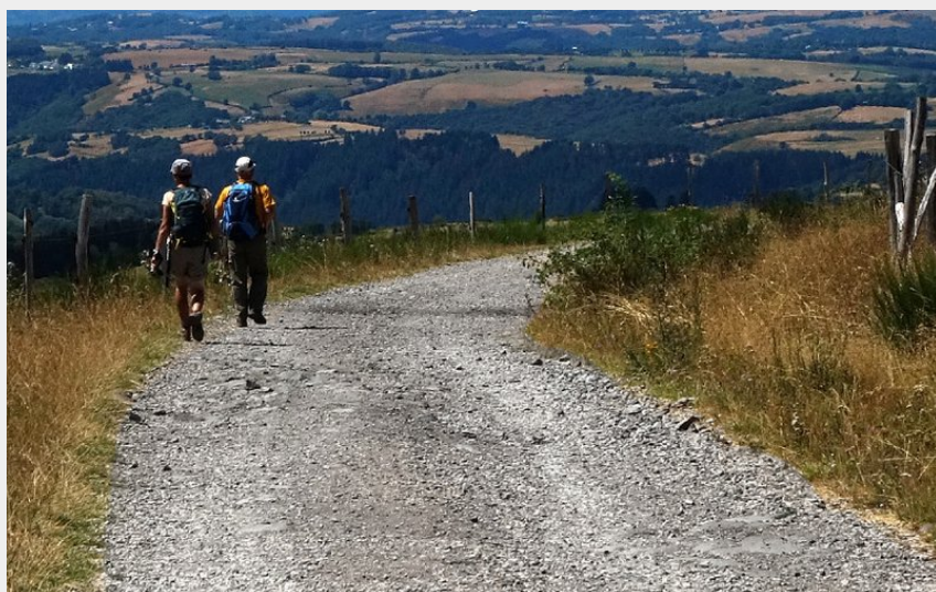
Randonneurs marchant vers le hameau des Enfrux (PNR Aubrac)