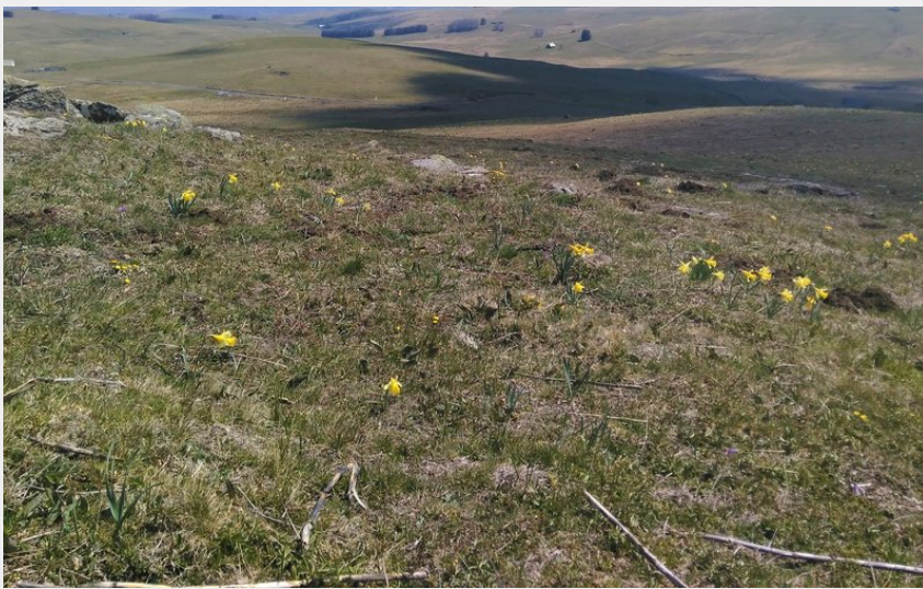
Les perspectives du haut-plateau