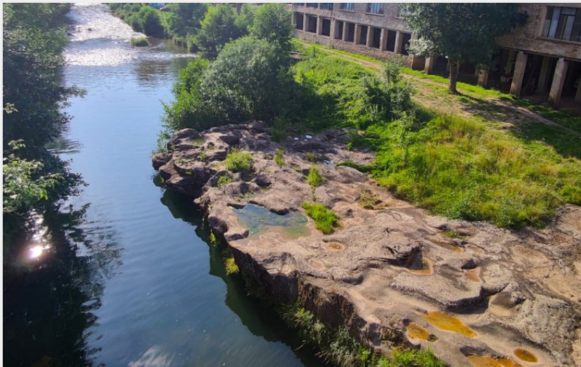
Traversée de la Sorgues depuis le pont neuf de Lapeyre