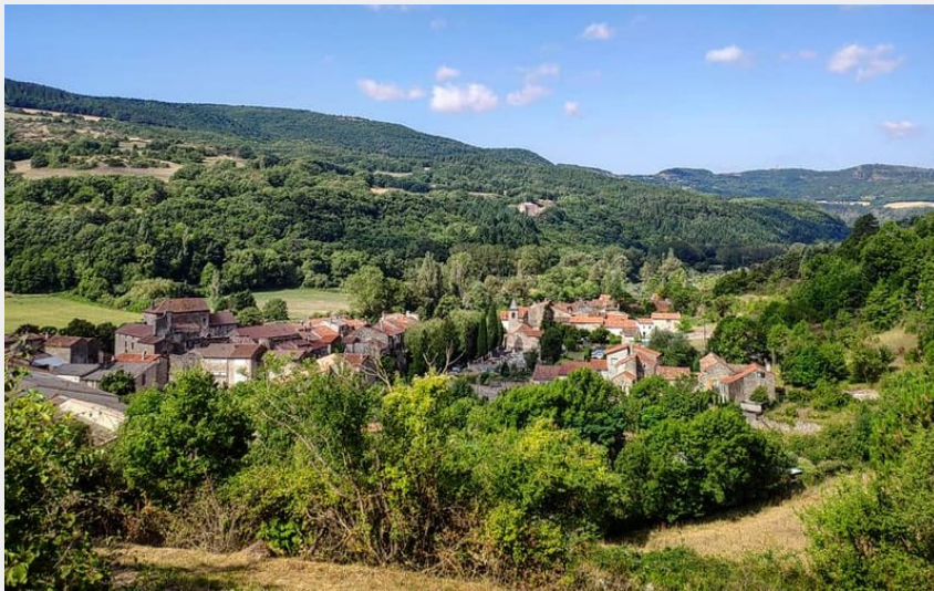
Village de Versols (Delphine Atche)