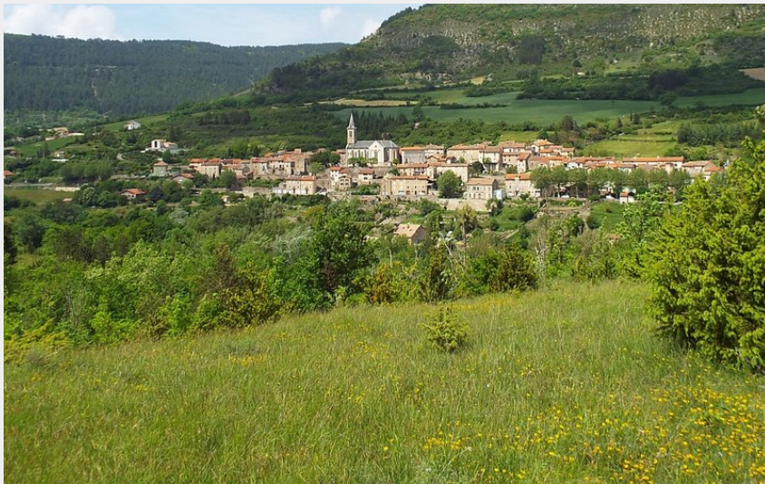
Vue sur le village de Saint-Félix-de-Sorgues (Delphine Atché)