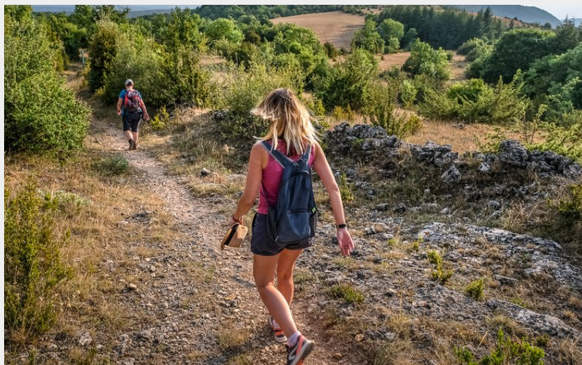
Sur le plateau du Guilhaumard