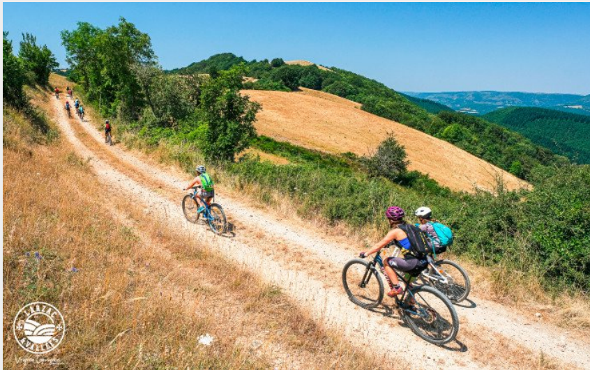
Sur le causse...