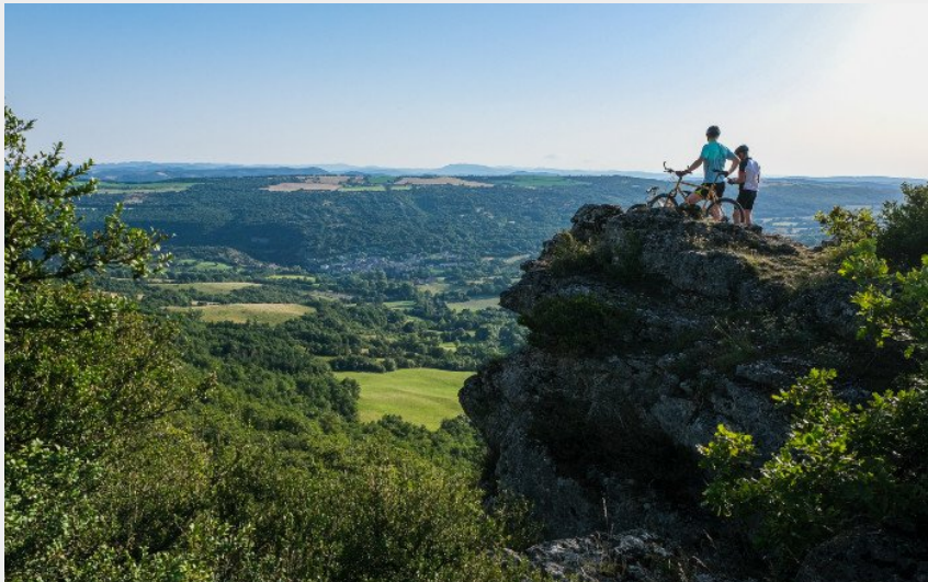
Panorama sur Saint-Beaulize