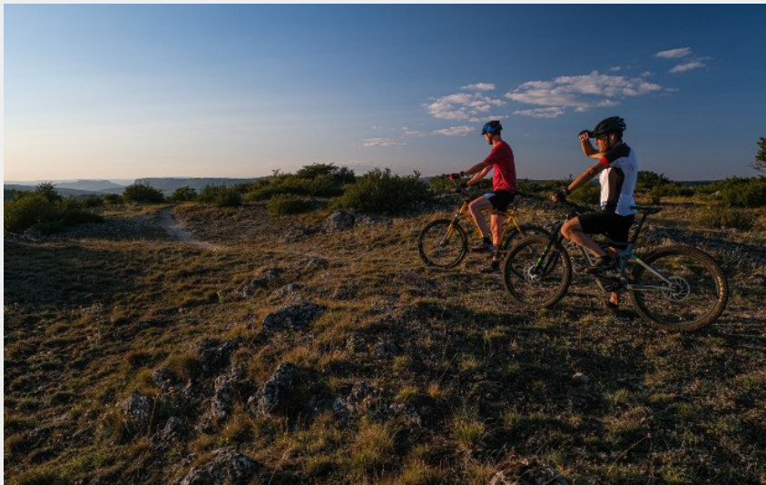
Le Pas de Tirecul