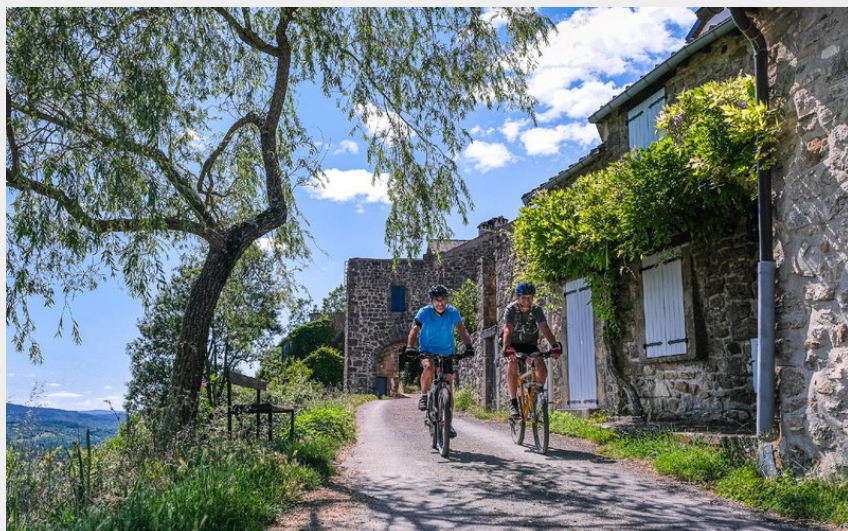
Dans le hameau d'Algues