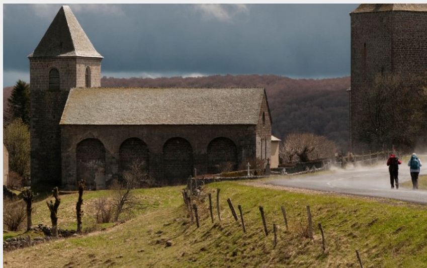
Randonneurs marchant vers Aubrac (Renaud DENGREVILLE)