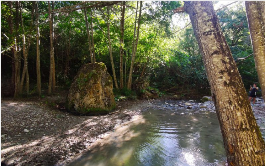
Sentier du Menhir (Roquefort Tourisme)