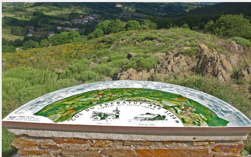
La vue panoramique depuis le col du Trébatut (500 mètres du circuit)