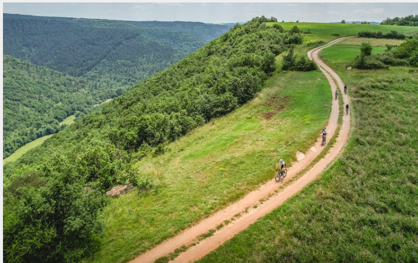
Plateau du Causse de Nissac, Corniche du Versolet (Virginie Govignon)