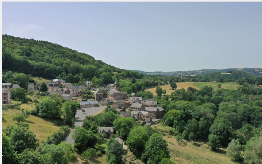
Le village de Nogaret, les balcons de l'Aubrac