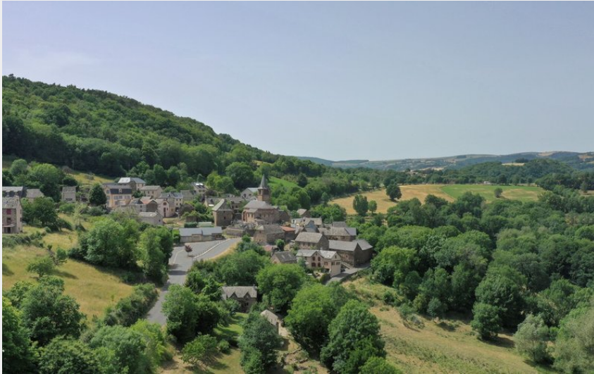
Le village de Nogaret, les balcons de l'Aubrac