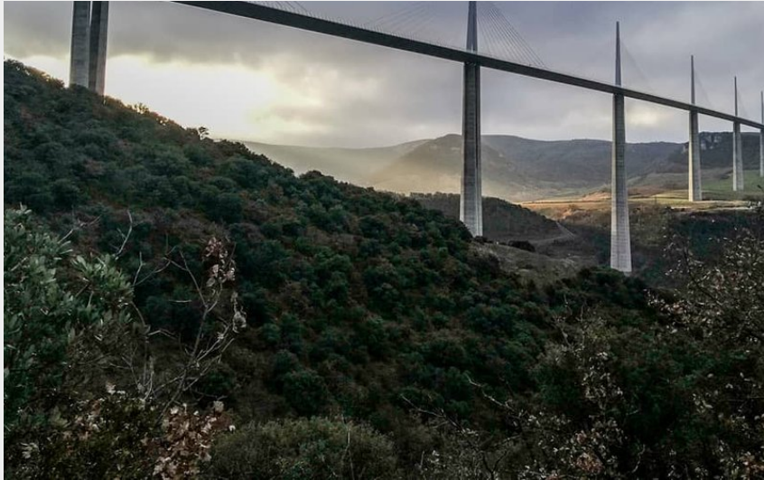
Viaduc de Millau par les sentiers (GBarrabe)