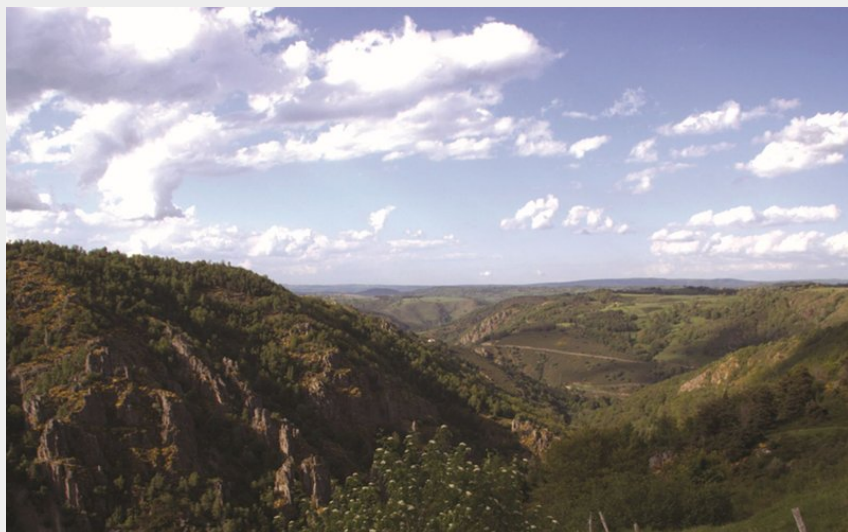
Les gorges du Bès