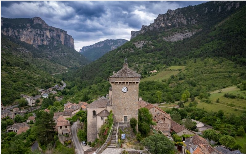
La Tour de Peyreleau - Gorges de la Jonte