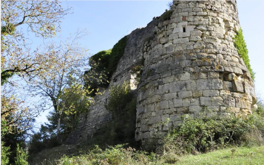
Ruines du château de Montferrand