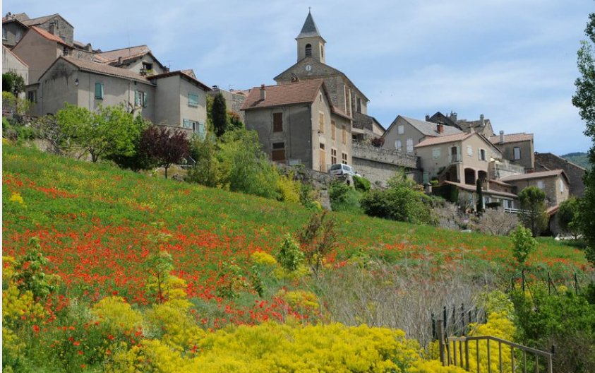
Cheminer au milieu des champs