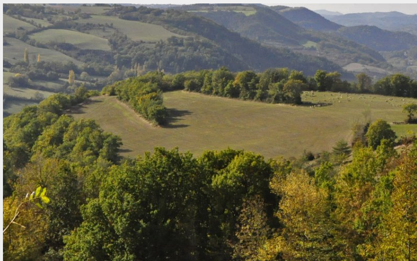
Vue du village de Coustous