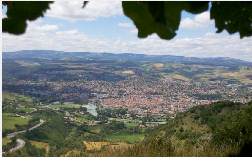
Millau vu du Larzac