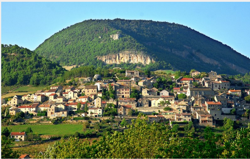
Vue sur Compeyre (Eric Teissedre)