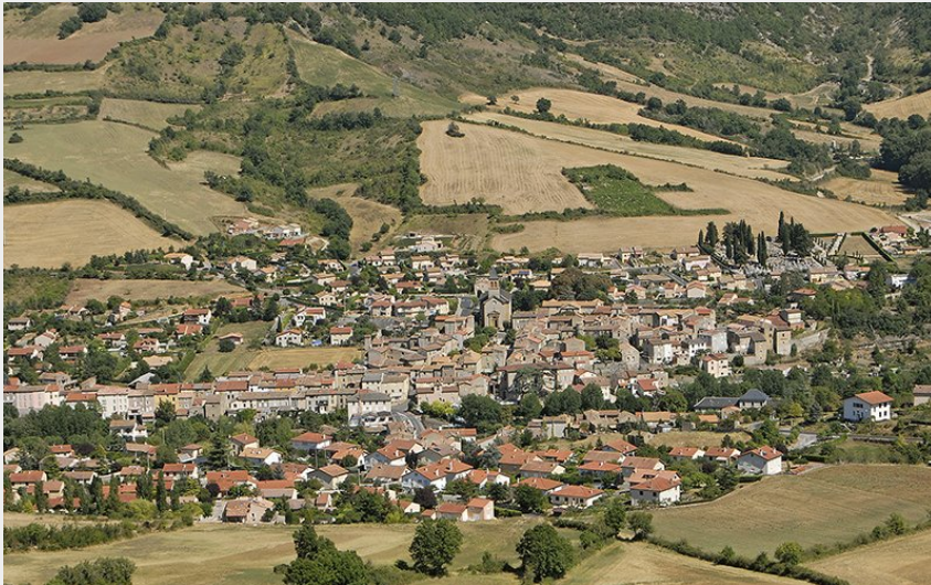
vue générale du village de Saint-Georges de Luzençon (Eric Teissèdre)