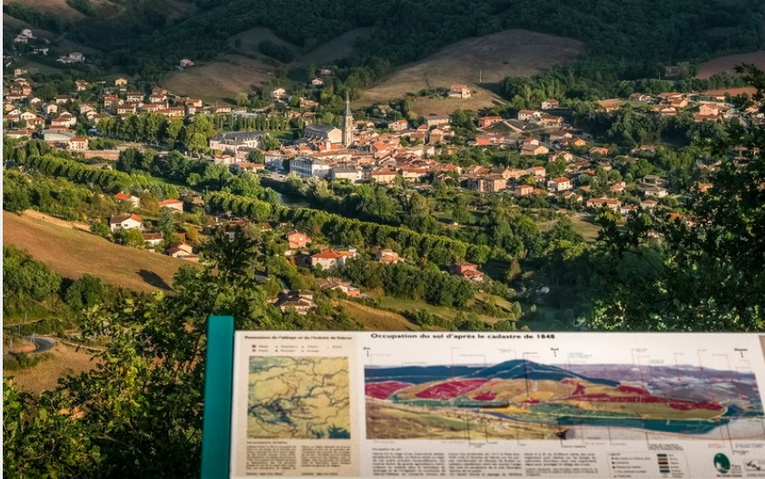
Panorama depuis Peyralbe (Virginie Govignon)