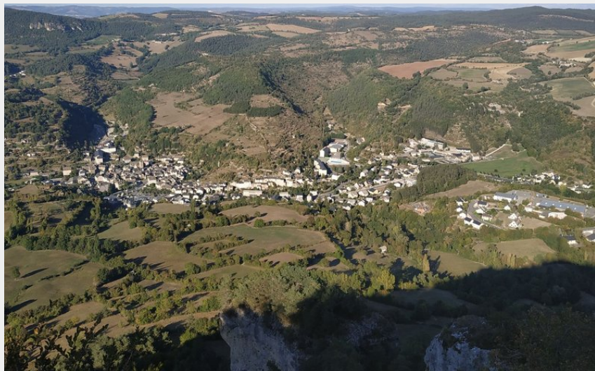
Vue sur la Canourgue