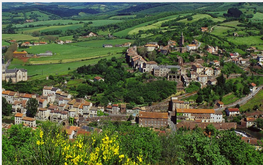
Vue du village (J.L Reynès)