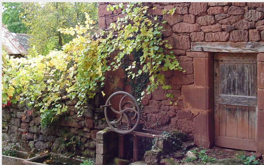
Maison en grès rouge