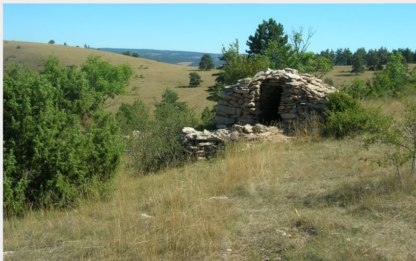
Chazelle sur la montagne fendue