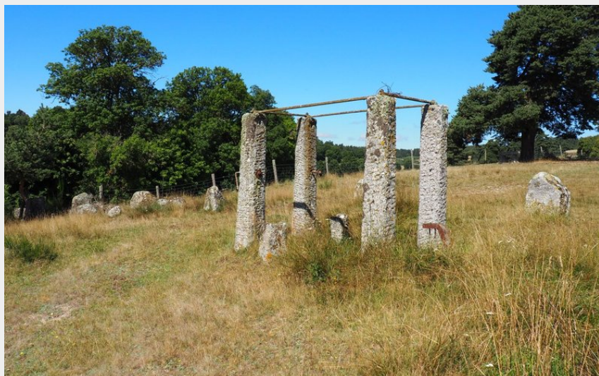
Ferradou (© OTCC Gévaudan Destination)