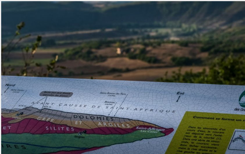
Table d'interprétation Peyralbe (Roquefort tourisme)